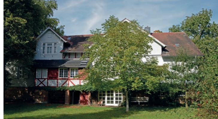
Otto Ubbelohde Haus in Goßfelden