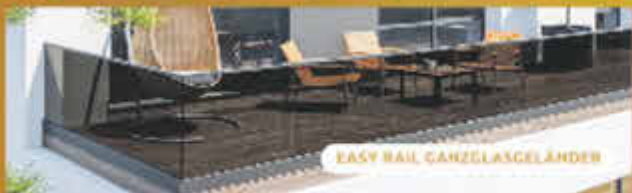
EASY RAIL GÄNZELASSELÄNDER