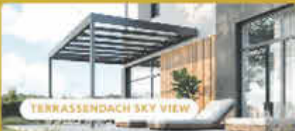
TERRASSENDACH SKY VIEW