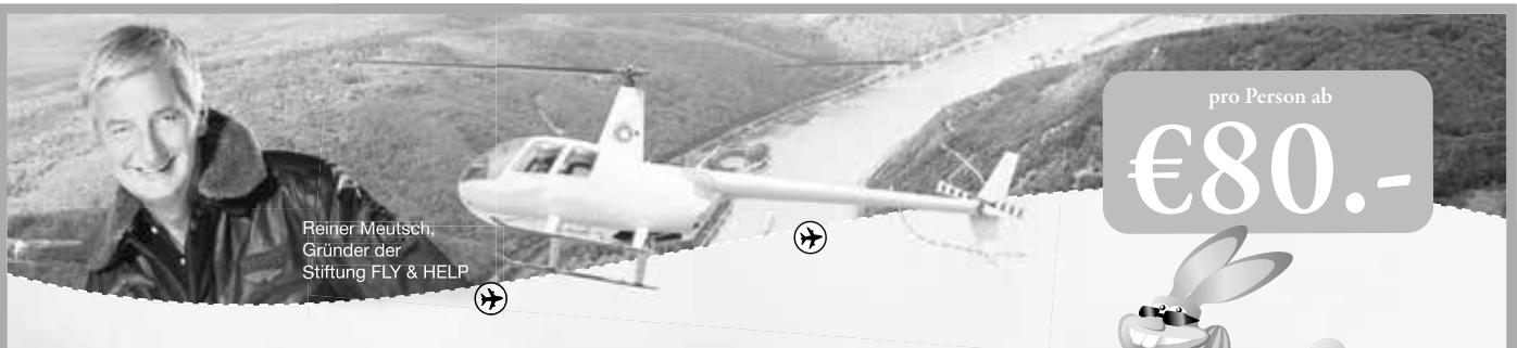
Reiner Meutsch, Gründer der Stiftung FLY & HELP