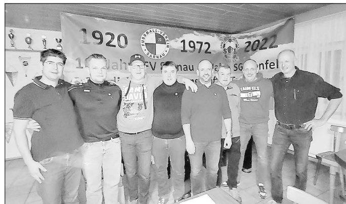
Das Foto zeigt die geehrten anwesenden Mitglieder.