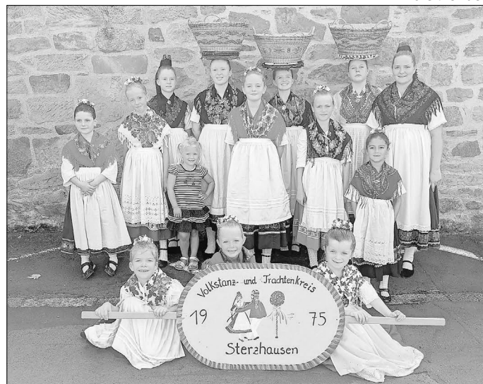
Unsere Kinder und Jugendlichen in der Marburger evangelischen Tracht beim Festzug in Fritzlar