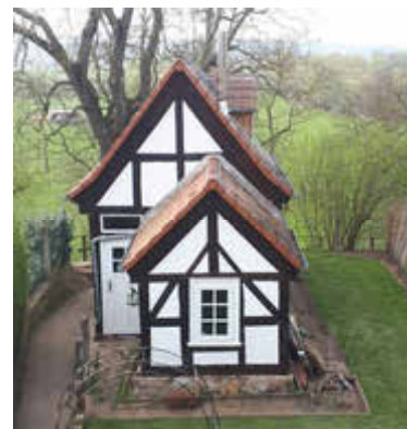
„Henshäuschen“ der Familie Grün - Bellhausen - Denkmalpreisträger 2022

mit jeweils 1.000,00 Euro pro prämiertem Objekt dotiert.