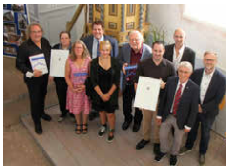
Die Preisträger*innen des Jahres 2021

Einsendeschluss ist der 30. September jeden Jahres