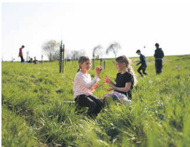
EAM-Stiftung 2023: Projekte aus vier verschiedenen Themenbereichen werden in diesem Jahr gefördert..

Sie engagieren sich für den Erhalt eines Denkmals in Ihrer Kommune? Sie betätigen sich in einer freiwilligen Jugendfeuerwehr? Oder Sie helfen in der Jugendarbeit einer Institution zur Rettung von Menschen? Dann ist Ihre Bewerbung bei