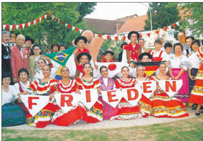
Feierliche Einweihung des Freundschaftsbrunnens mit Gästen aus Japan und Brasilien