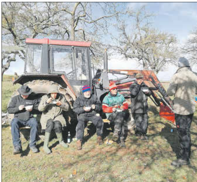
Stärkung zur Pause

Homepage: https://mgv-sterzhausen.jimdofree.com/