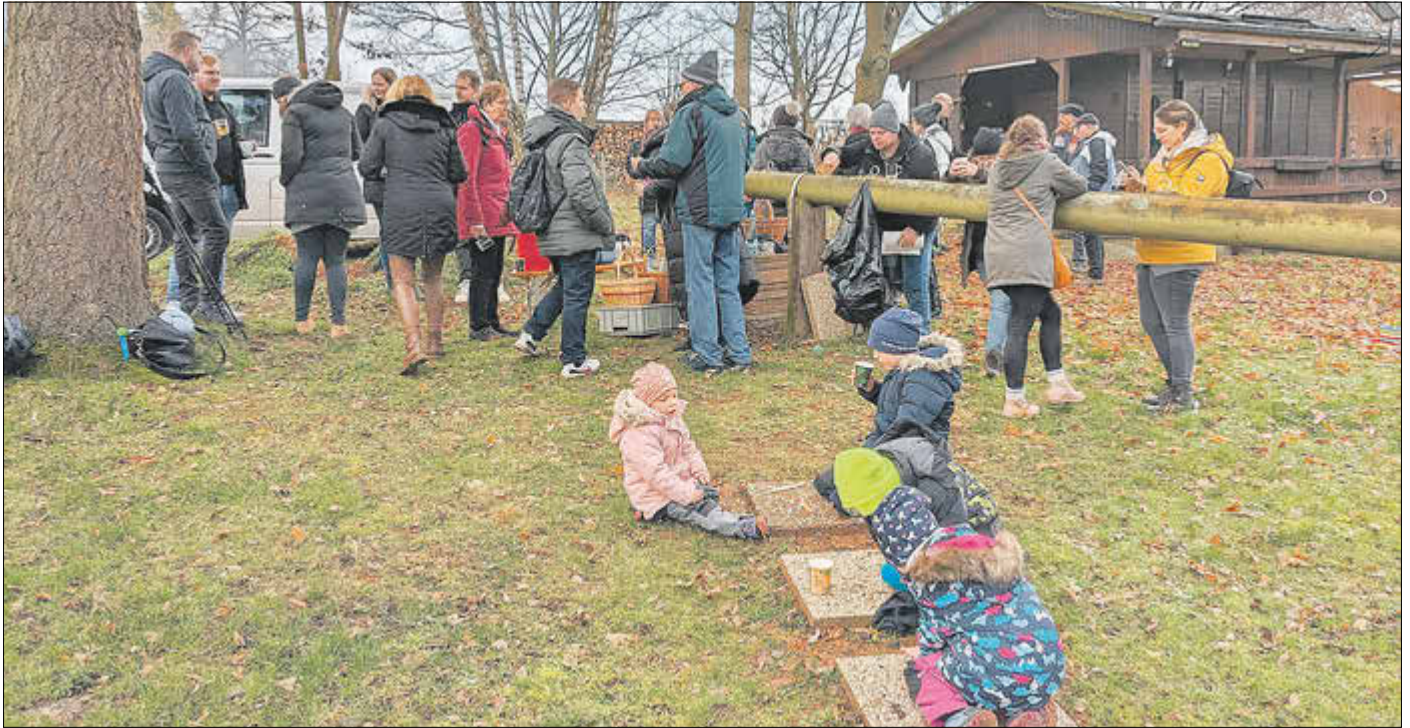
Teilnehmer an der Winterwanderung - Wanderstopp an den Wochenendhäusern